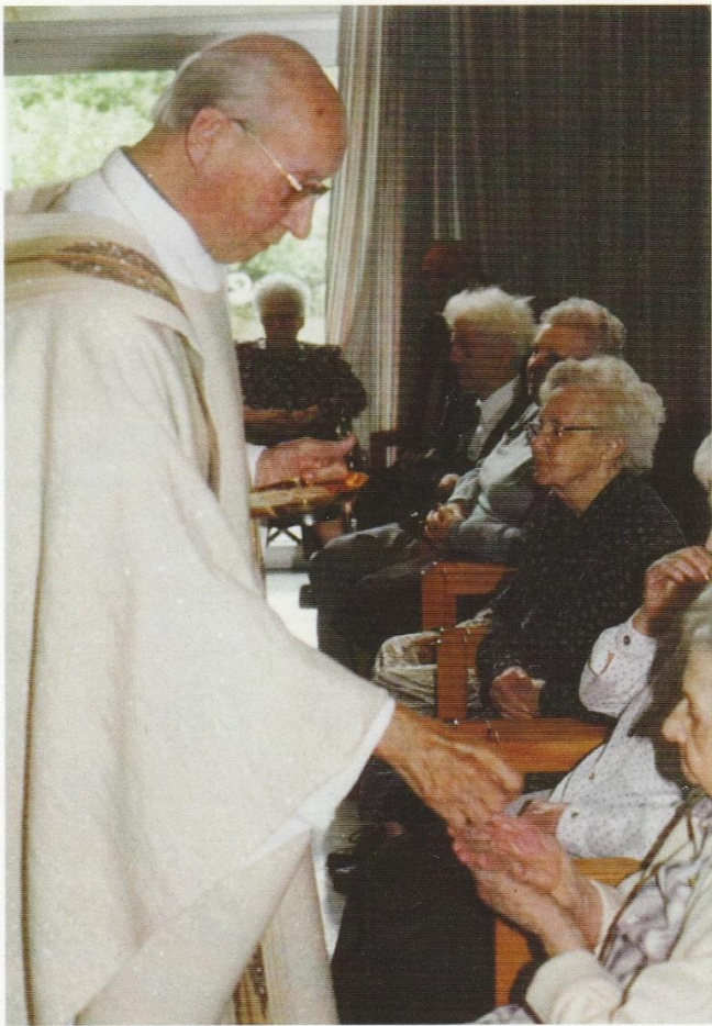
Lückerheidekliniek "Sacramentsdag 2000"