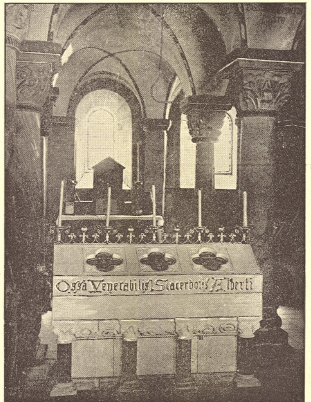
Sarcophaag van Ailbertus.

In de eenvoudige houten sarcophaag bleef het stoffelijk overschot van Ailbertus rusten in de eerbiedwekkende crypte, tot het in 1897 door Mgr H. van de Wetering werd geplaatst in een gebeeldhouwd steenen monument uit de kunstwerkplaatsen van Dr P. J. H. Cuypers te Roermond.