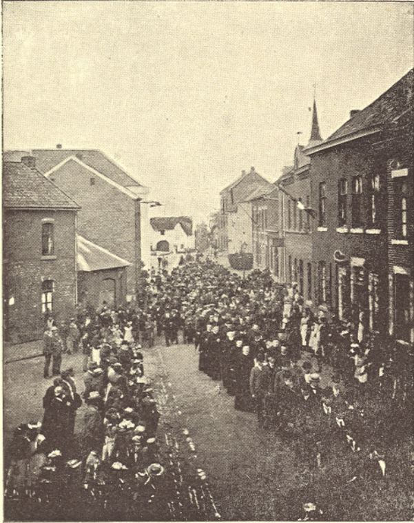
Overbrenging van het gebeente van Ailbertus naar Rolduc.

trok de stoet door het feestelijk versierde dorp over Holz naar Rolduc. De sarcophaag werd gedragen door vier eerwaarde heeren professoren. Duizenden toeschouwers waren van alle kanten toegestroomd. De meeste begeleidden den stoet in stille ingetogenheid tot voor de poorten van Rolduc.