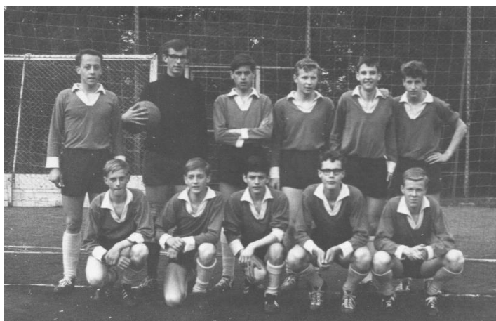
Het winnend elftal! Uiterst gespannen voor de wedstrijd.