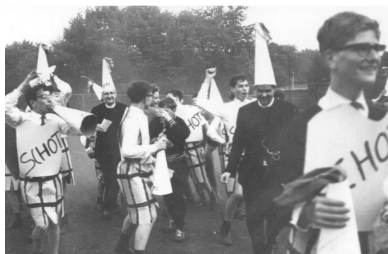
Volop vreugde na een goal!