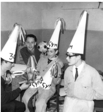
Druk aan het werk!

Een hoogtepunt waren jaarlijks de klassenwedstrijden tussen 3, 4 en 5 gymnasium. Traditie was, dat 3 gym zich bij de eerste wedstrijd in deze kleine competitie op een ludieke manier presenteerde. Het was dan een uitdaging voor 4 gym om vooraf te ontdekken met welke ludieke actie 3 gym op de proppen zou komen. Met onze klassenleraren, meneer Berkels en meneer Lenders, werden begin 1966 geheime plannen gesmeed. Enkele creatieve geesten hadden bedacht om op te komen in een gewaagde schotse outfit met op de voorzijde het woord 'schot' en aan de achterzijde het woord 'goal'. Tijdens de paasvakantie werden alle attributen bij mij thuis in Stramproy geknipt, geplakt en geverfd. We verheugden ons allemaal op een verrassende opkomst.