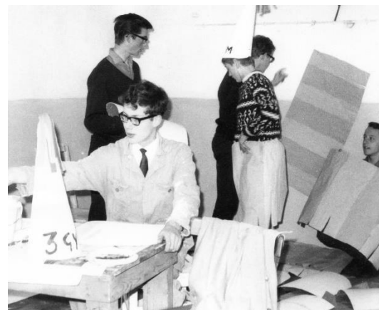
Foto rechts vlnr: dezelfde personen en ondergetekende bij de muur.