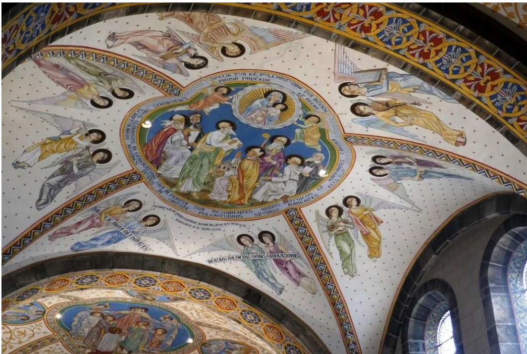
Kerkgewelf Rolduc anno 2023