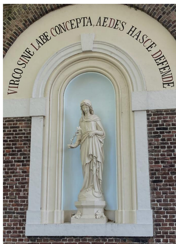
Maria met lelie