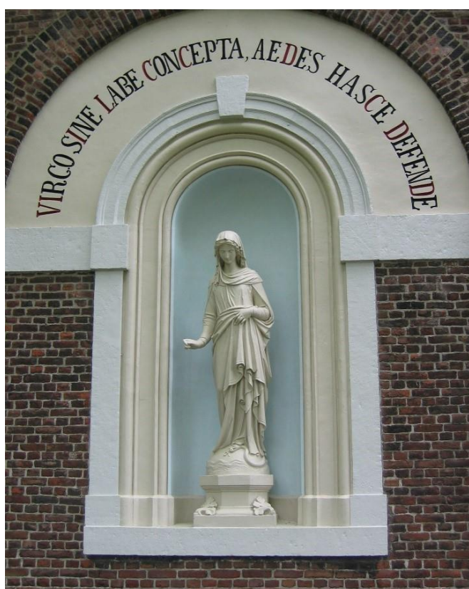
Maria zonder lelie